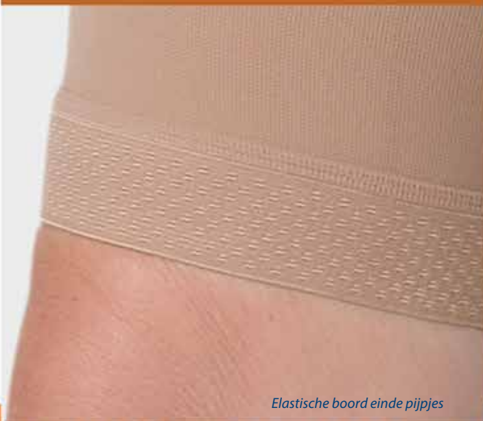
Elastische boord einde pijpen