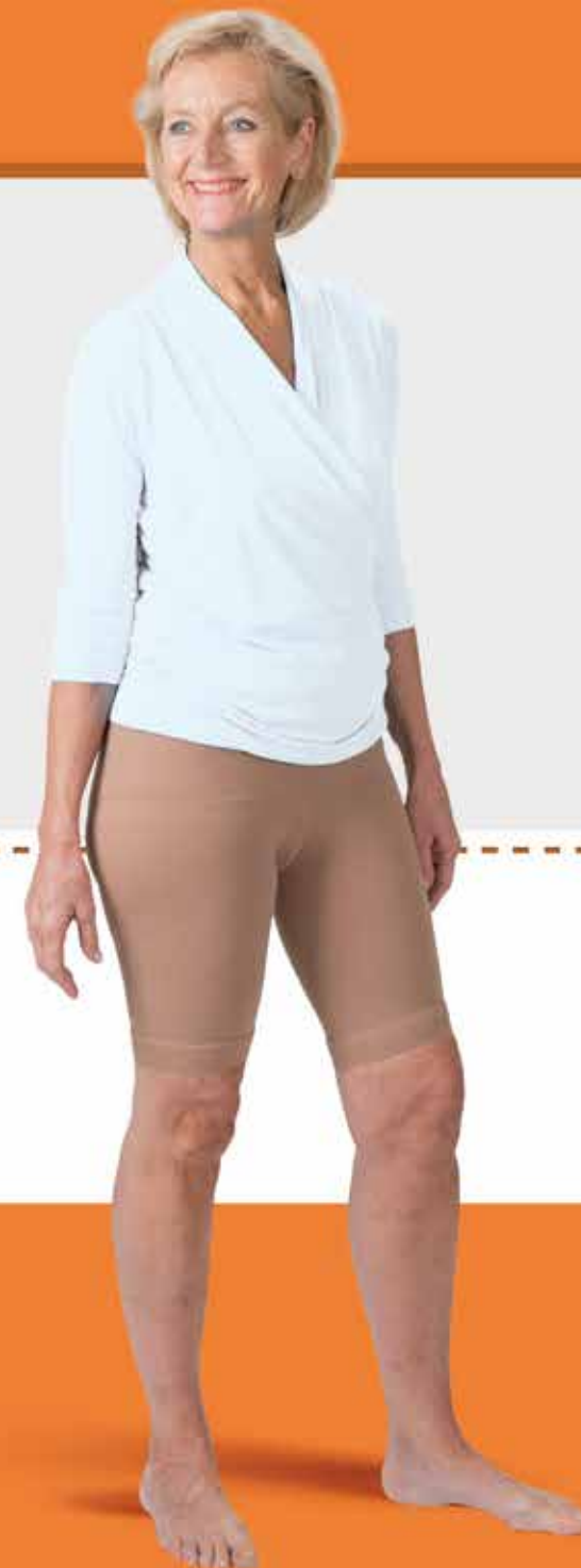
Maattabel TinkFit® (in cm)